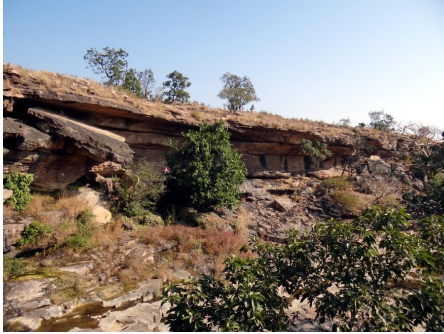
चित्र विशाल शैलाश्रय, चिब्बड़नाला Big Rock shelter, Chibbad nala.