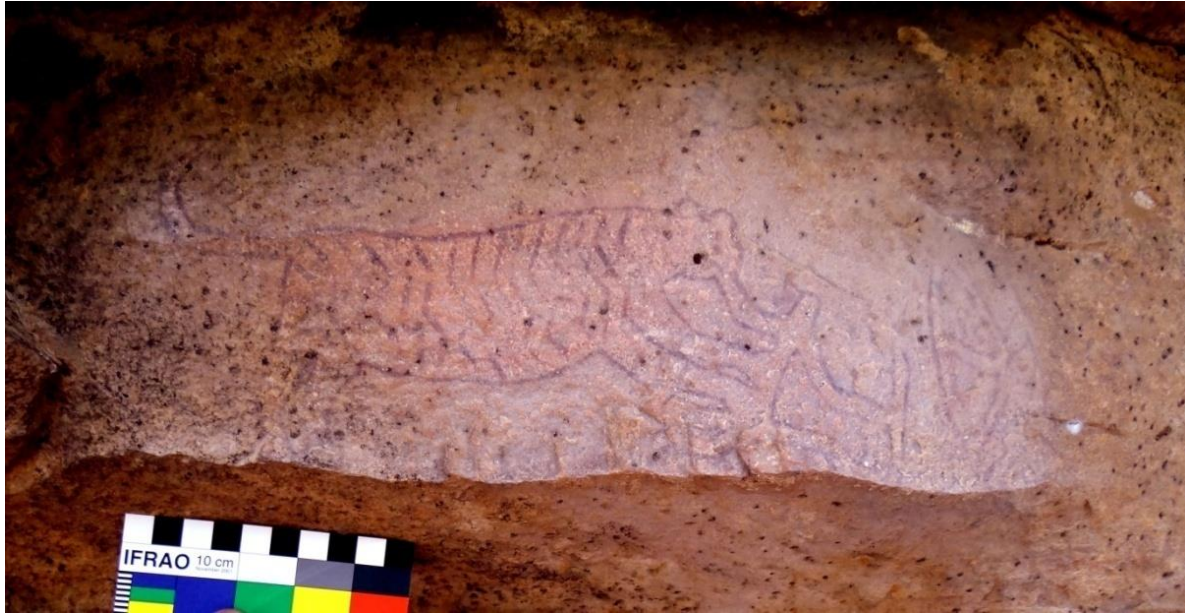
चित्र 4. शेर के आक्रमण का सामना करते धनुर्धर, चिबडनाला, मध्याश्मीय A hunter shooting an arrow on the head of a tiger who has caught hold of his fellow hunter's hand, a good example of the fellow spirit. Mesolithic. Chibbad nala.