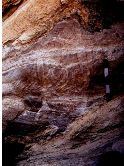
चित्र 7. विशाल मगर शल्य क्रिया युक्त गॉंधी सागर, मध्याश्मीय Dissected big reptile, more than 160 cm long. Gandhisagar. Mesolithic.