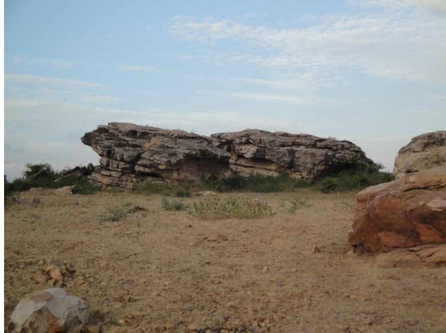
चित्र 9. शैलाश्रय, मोडी Rock shelters in big quartzite boulders at Modi in Bhanpura region, Chambal valley.