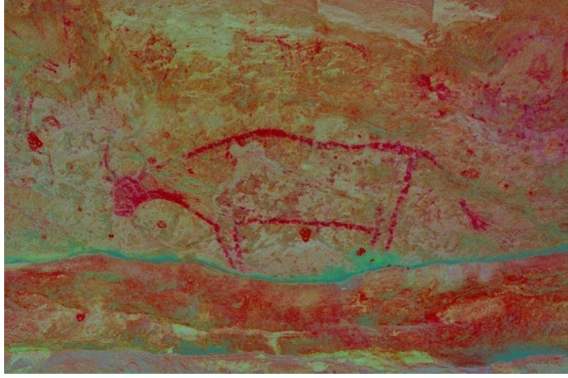
चित्र 5. विशाल वन वृषभ, चिबबड़नाला, मध्याश्मीय A big bison in red outline in Chormata rock shelter at Chibbad nala in Chambal valley. Early Mesolithic or Upper Palaeolithic. Courtesy Yann P. Montelle.