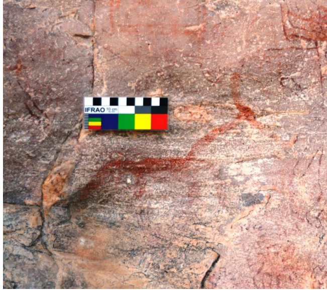
चित्र: लम्बी गर्दनवाला पशु (abstract form), ताम्राश्म कालीन, मोडी