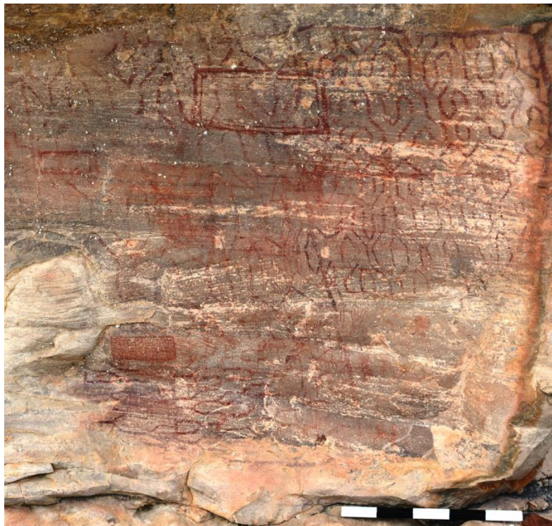
चित्र: विशाल आकार की डिज़ाइन, मध्याश्म कालीन मोडी