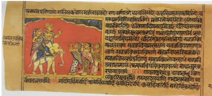
चित्र संख्या 3

तृतीय पत्र में सौधर्म इन्द्र अपनी देवी धृति, कृति आदि देवियों को भरत क्षेत्र जाकर रानी मरुदेवी की सेवा करने का आदेश दे रहे हैं स्वयं इन्द्र के शरीर पर चित्रकार ने आँखों को चित्रित किया है। जो कि यह दर्शाता है कि इन्द्र ने 1008 आँखों से भगवान को देखा था। इस चित्र में मुख्य लाल, पीला, नीला रंगों से चित्र को चित्रित किया गया है।