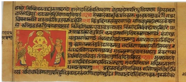
चित्र संख्या 4

प्रस्तुत पत्र के चित्र में भगवान आदिनाथ की स्तुती की गयी है जो कि मुख्य आकृति होने से पीले रंग में चित्रित है।