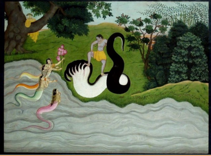
चित्र 2 भागवत पुराण- कालिया मर्दन, कालिया की पत्नियाँ अपने पति नाग कालिया को मुक्त करने के लिए कृष्ण से प्रार्थना करते हुए, कांगड़ा शैली, वर्ष- 1785, संग्रह स्रोत- राष्ट्रीय संग्रहालय, नई दिल्ली।

दूसरी ओर, चित्र 2 (कालिया मर्दन लीला) कांगड़ा शैली की कोमलता, लयात्मकता और भावप्रवणता का श्रेष्ठ उदाहरण है। इसमें कृष्ण को यमुना में नागराज के फन पर संतुलित नृत्य की मुद्रा में दिखाया गया है। उनकी शांत और निर्भीक मुद्रा देवी सामथ्र्य और संतुलन का प्रतीक है। वृक्षों की शाखाओं पर रखे मुकुट और वस्त्र उनकी बालसुलभता को दर्शाते हैं। नागराज के फनों की ऐंठन और पीड़ा, नाग पत्नियों की शरणागत मुद्राएँ तथा कमल पुष्प का अर्पण चित्र में दया, क्षमा और भक्तिभाव का वातावरण रचते हैं। पृष्ठभूमि में वृक्षों की हरियाली, जल की तरंगें और नीली-हरित छाया प्राकृतिक सौंदर्य और लय का संचार करती हैं। कांगड़ा शैली की विशिष्टताओं, कोमल रेखांकन, भावपूर्ण मुखाकृतियाँ, स्वाभाविक रंग योजना और नारी आकृतियों की कोमलता का यहाँ उत्कृष्ट प्रदर्शन हुआ है।