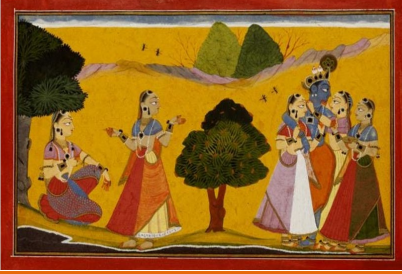
चित्र 4 गीत गोविंद- रास में रमे श्यामः सखी की राधा से शिकायत, बसोहली शैली, वर्ष- 1730-35, चित्रकार- मनकू, संग्रह स्रोत- विक्टोरिया और अल्बर्ट संग्रहालय, लंदनध्विजमैन आर्ट लाइब्रेरी, लंदनध्व्यूयॉर्क।

प्रस्तुत दोनों चित्र 5 और चित्र 6 भगवान श्रीकृष्ण की लीलाओं को केंद्र में रखते हुए विभिन्न शैलीगत एवं भावात्मक विशेषताओं को प्रकट करते हैं। चित्र 5 (कृष्ण की वस्त्रहरण लीला) बीकानेर शैली का उत्कृष्ट उदाहरण है, जिसमें श्रीकृष्ण वृक्ष की डाल पर बैठकर गोपियों के वस्त्र चुराए हुए हैं। यह प्रसंग शृंगारिक माधुर्य और हास्य के भावों से ओत-प्रोत है। गोपियाँ सरोवर में स्नान के पश्चात् जल से बाहर निकलने हेतु लज्जा और संकोच में कृष्ण से अनुनय कर रही हैं, कुछ गोपियाँ वृक्षों के पीछे लज्जावश छिपती हुई भी दर्शाई गई हैं। पृष्ठभूमि में गुलाबी पहाड़ियाँ, वृक्ष, पक्षी, गौएँ और हल्का नीला आकाश एक अलौकिक, रमणीय वातावरण निर्मित करते हैं। रेखांकन अत्यंत सूक्ष्म है, विशेषकर वृक्षों, गोपियों के केश और वस्त्रों में। रंग योजना कोमल और संयत है- हरा, गुलाबी और नीले का सुंदर सामंजस्य दृश्य को माधुर्य प्रदान करता है। भावाभिव्यक्ति में कृष्ण के मुख पर हास्य और शरारत, गोपियों के मुख पर लज्जा और विनय स्पष्ट है, जिससे चित्र में नाटकीयता और सौंदर्य का अद्भुत संतुलन दृष्टिगत होता है।