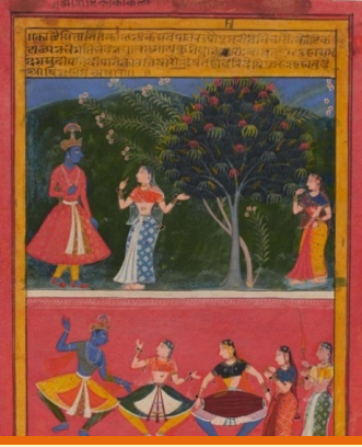
चित्र 3 रसिकप्रिया- राधा की मधुर हँसी और कृष्ण की रासलीला, मेवाड़ शैली, वर्ष- 1630-35, चित्रकार- साहिबदीन, संग्रह स्रोत- राजकीय संग्रहालय, उदयपुर।