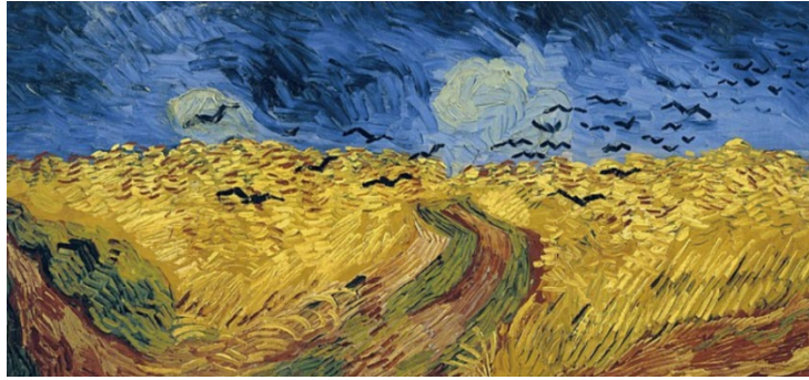
चित्र 7 ए पेयर ऑफ ओल्ड शूज Walker (1981)