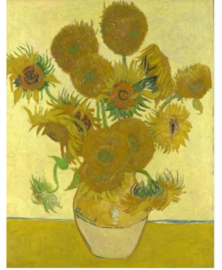
चित्र 6 सूरजमुखी के फूल Walker (1981)