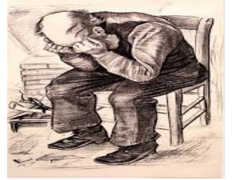
चित्र 2 ओल्ड मैन इन सारो Walker (1981)