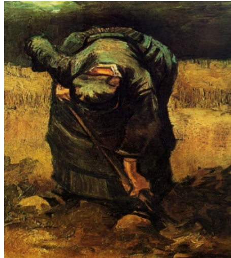
चित्र 3 पीजेन्ट वूमन डिंगिंग Walker (1981)