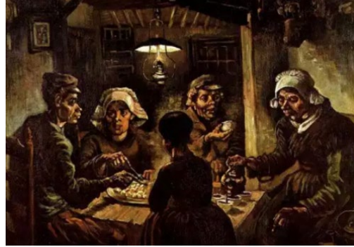
चित्र 1 पोटैटो ईटर्स Van Gogh (1885)

इस प्रकार वानगो का भावुक मन आज भी हर चित्र में लोरी गुनगुनाता हुआ सा प्रतीत होता है और दर्षक भावविभोर हो उनकी अन्तरात्मा तक पहुंच कर रंग और रेखाओं के माध्यम से नयी नयी संभावनाओं को खोज ही लेता है।