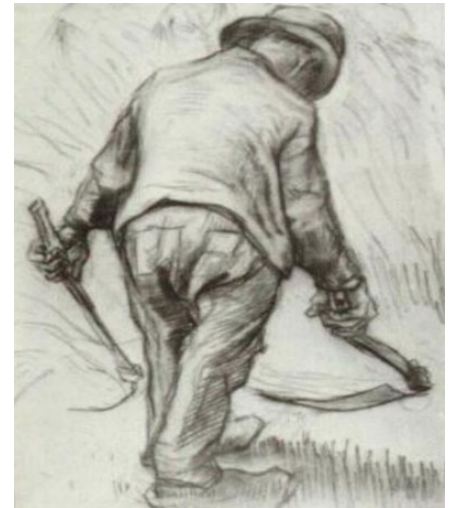
चित्र 4 पीजेन्ट विथ सिकिल Walker (1981)