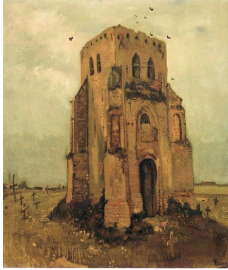
चित्र 5 पीजेन्ट सेमिटरी Walker (1981)