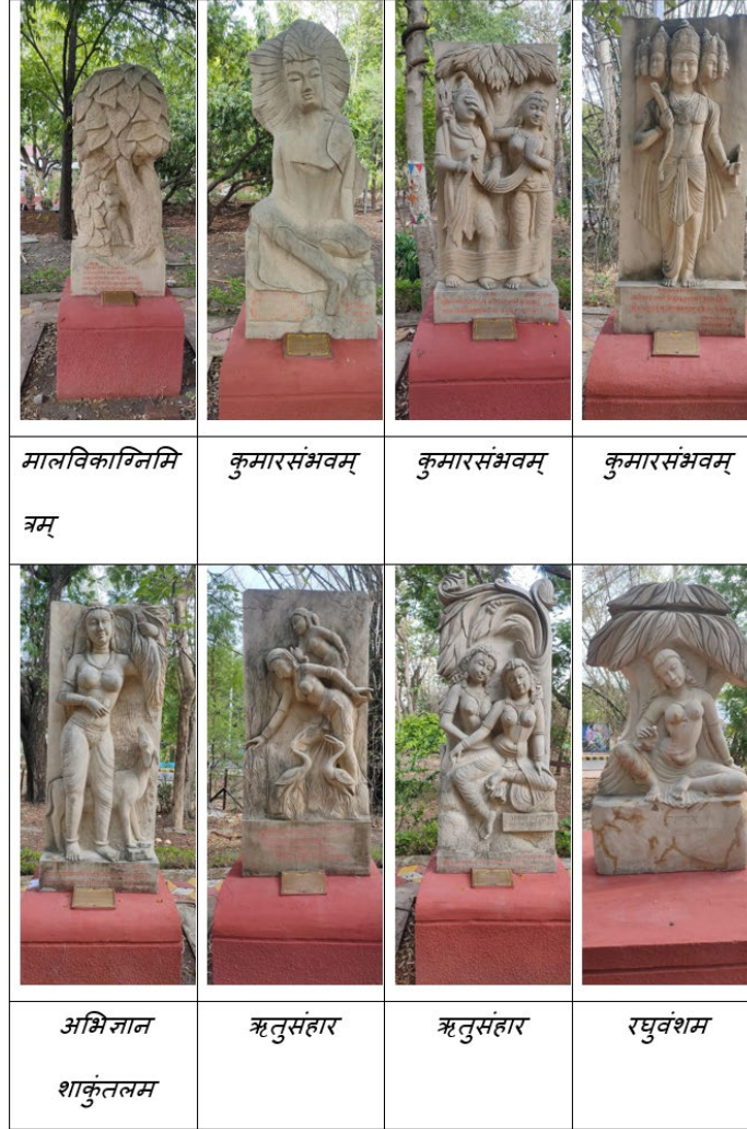
चित्र 6: संस्कृत कवि कालिदास की कृतियों पर आधारित मूर्तियां।