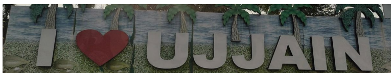
चित्र 7: उज्जैन म्युनिसिपल ऑफिस के पास आई लव [सिटी नाम] इंस्टॉलेशन