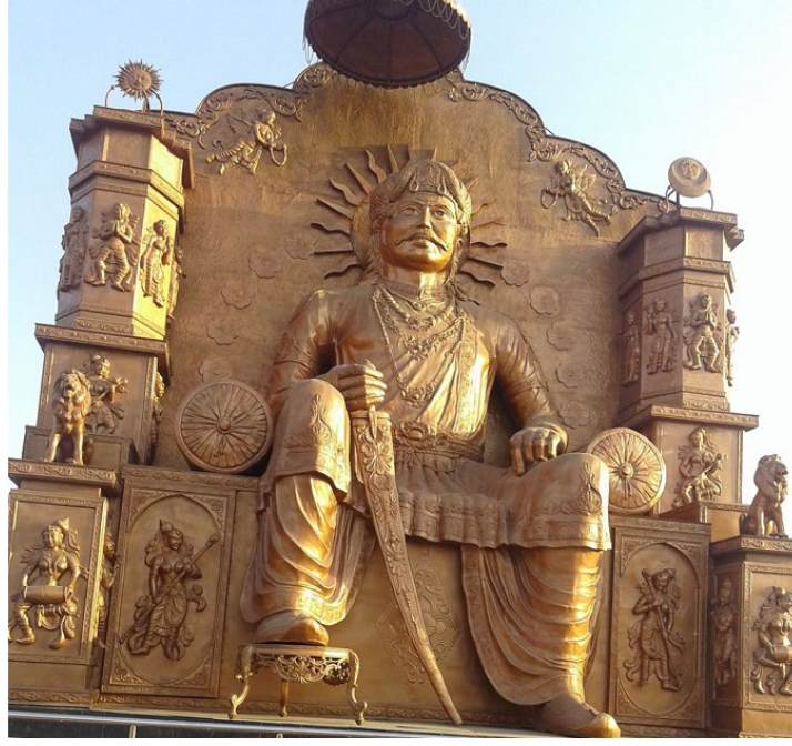
चित्र 4: चक्रवर्ती सम्राट विक्रमादित्य और उनके सिंहासन की मूर्ति, सिंहासन बत्तीसी को दर्शाती है (विक्रमादित्य मंदिर, उज्जैन)