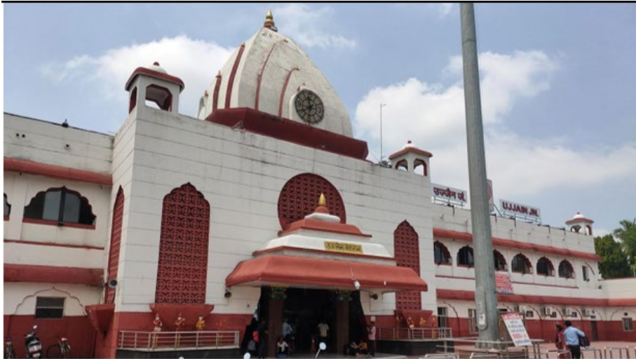
चित्र 1 मंदिरों के लिए मशहूर शहर उज्जैन का रेलवे स्टेशन मंदिर की तरह ही डिज़ाइन किया गया है। यह शहर को साफ़ तौर पर दिखाता है और बताता है कि आप शहर में क्या देखेंगे।