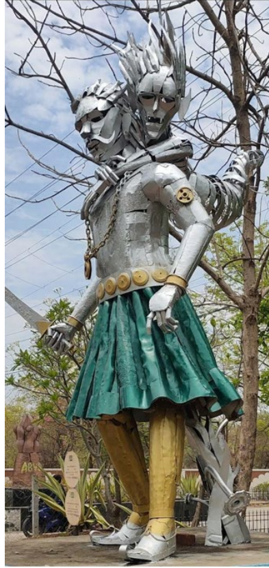
चित्र 5: उज्जैन के विक्रम विश्वविद्यालय में राजा विक्रमादित्य और बेटाल की धातु की मूर्ति, जो बेटाल पच्चीसी कथा को दर्शाती है