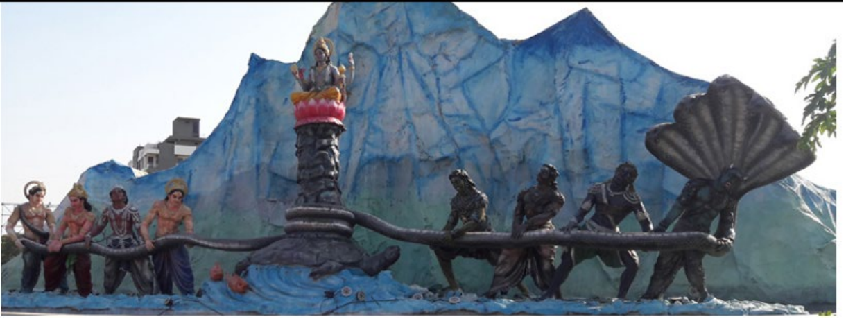
चित्र 2: समुद्रमंथन की कथा को दर्शाता की आर्ट इंस्टॉलेशन, उज्जैन