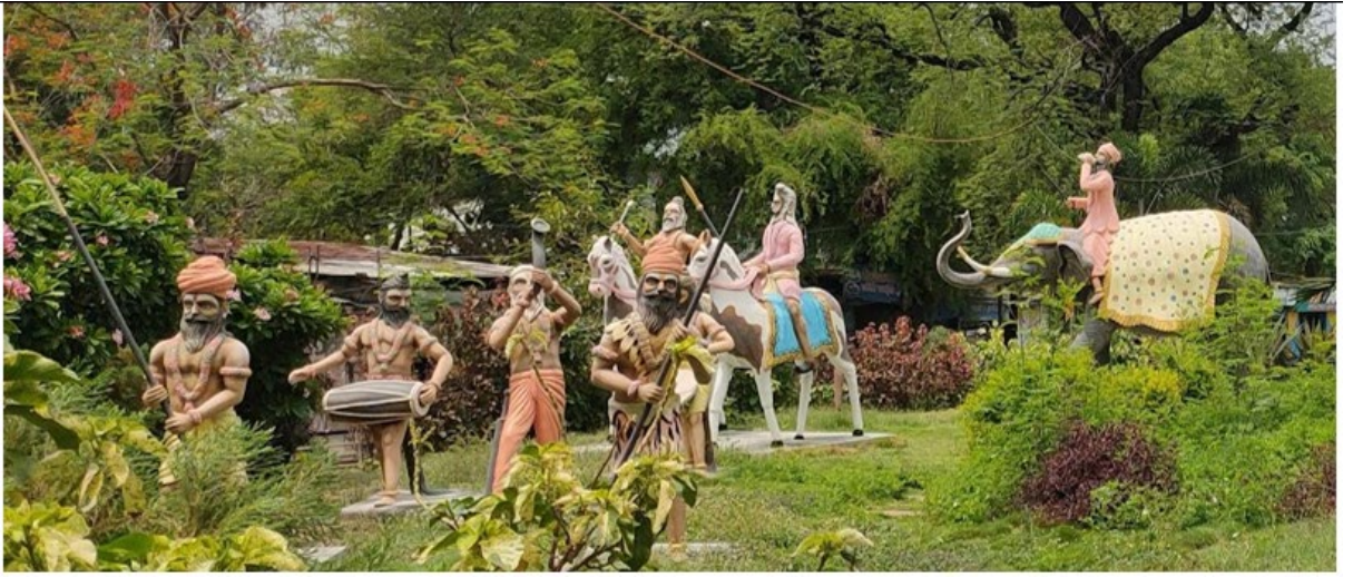
चित्र 3: उज्जैन में कुंभ मेले के दौरान साधुओं के यात्रा को दिखाती मूर्तियां